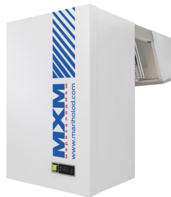
Таблица технических данных